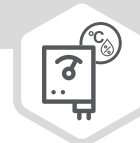
Controladores de Temperatura y Humedad, si el sistema lo requiere