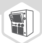
Variador de Frecuencia

El Variador de Frecuencia está compuesto por: